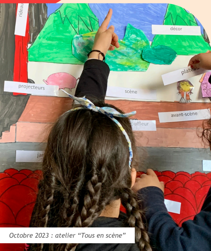
Octobre 2023 : atelier "Tous en scène"

De son côté, La Compagnie Miel de Lune sensibilisera les élèves de deux classes de CM2 à la littérature théâtrale contemporaine, aux correspondances entre ce genre et de nombreux autres. Participants de la bibliothèque et élèves auront enfin l'occasion d'accomplir un parcours de spectateurs de théâtre en assistant aux représentations de plusieurs spectacles jeunes publics proposés par le Théâtre L'Onde à Vélizy-Villacoublay.