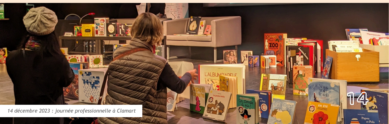
14 décembre 2023 : journée professionnelle à Clamart