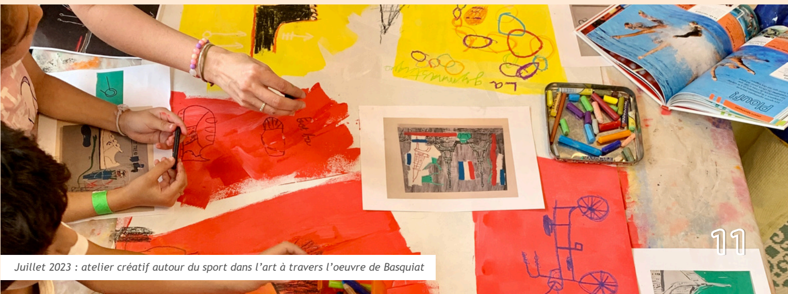
Juillet 2023 : atelier créatif autour du sport dans l'art à travers l'oeuvre de Basquiat